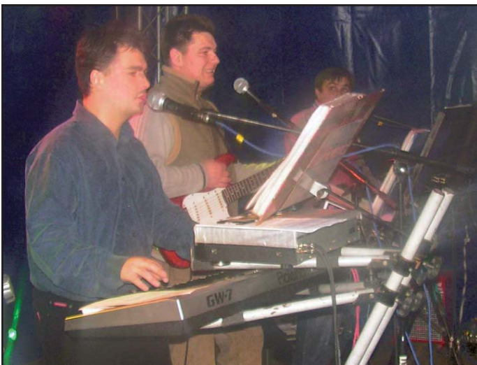
Do zabawy zagrzewał zespół „Ritmo”