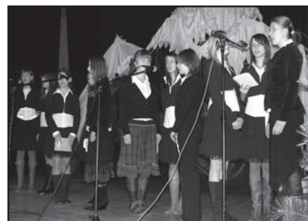
Występ Scholi ANGELICO