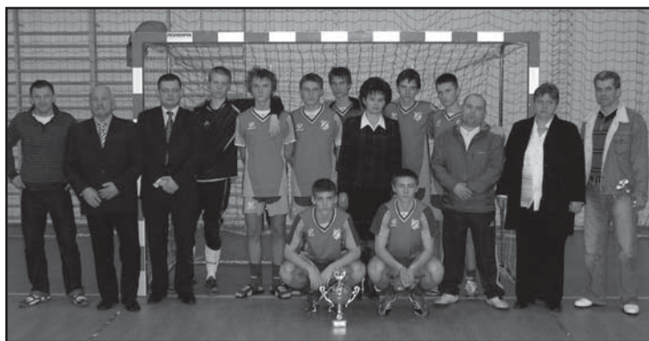
Drużyna GKS Świt Warszawa, goście honorowi oraz organizatorzy Turnieju