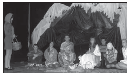
Jasełka uczniów z Zespołu Szkół