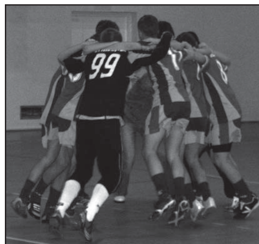
Tak ze zwycięstwa cieszyli się piłkarze GKS Świt Warszawa