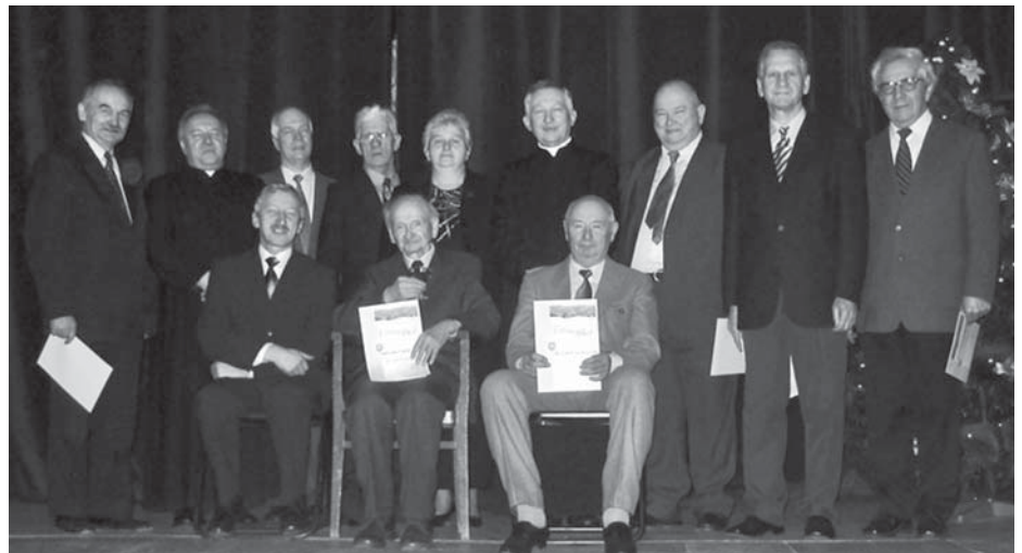
Członkowie TPT obecni podczas Jubileuszu